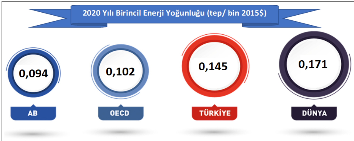
Şekil 1. Birincil Enerji Yoğunluğu Karşılaştırması (2020)

Uluslararası bir karşılaştırma yapılacak olursa; Türkiye'nin 2020 yılı için 0,145 tep/bin 2015 $ olan birincil enerji yoğunluğu dünya ortalamasından (0,171 tep/bin 2015$) daha düşük olmakla birlikte OECD ortalamasının (0,102 tep/bin 2015$) üzerinde kalmaktadır. Avrupa Birliği ülkelerinin birincil enerji yoğunluğu ortalaması ise 0,094 tep/bin 2015$ ile gerek OECD gerekse Türkiye'ye kıyasla daha iyi bir seviyededir.